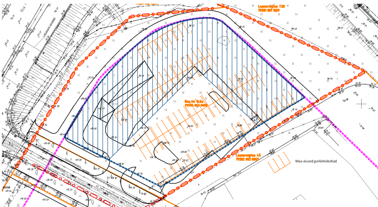
Skeem 1. Maa-aluse parkla orienteeriv parkimisskeem, parkimine võimalik lahendada kahel maa-alusel korrusel

Üks võimalik maa-aluse parkla lahendus on esitatud alloleval skeemil (skeem 1). Täpne parkimislahendus määratakse ehitusprojekti.